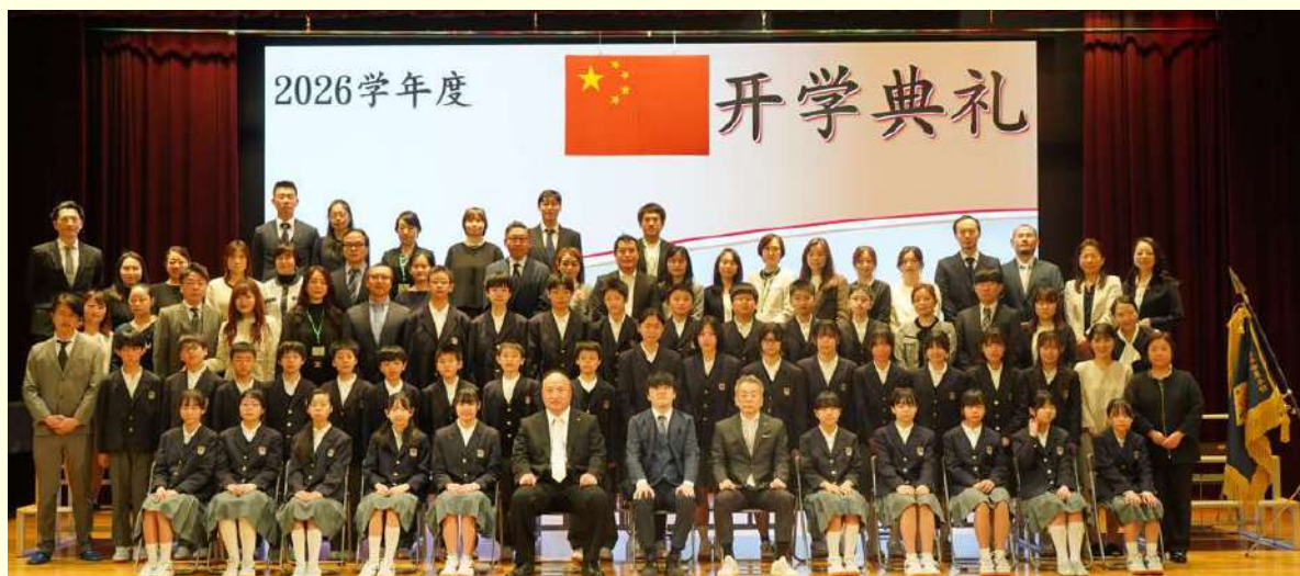
中一②班及家长合影