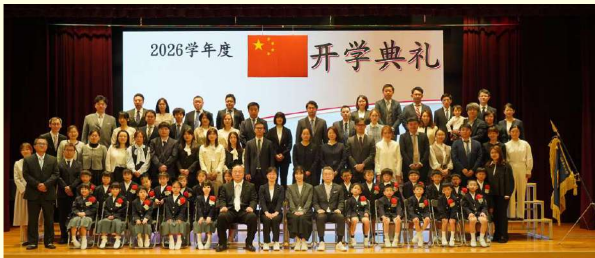
小一③班及家长合影