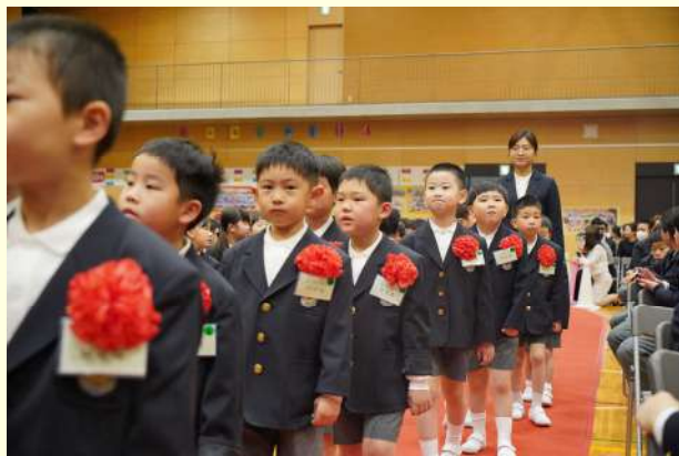
小学一年级新生入场