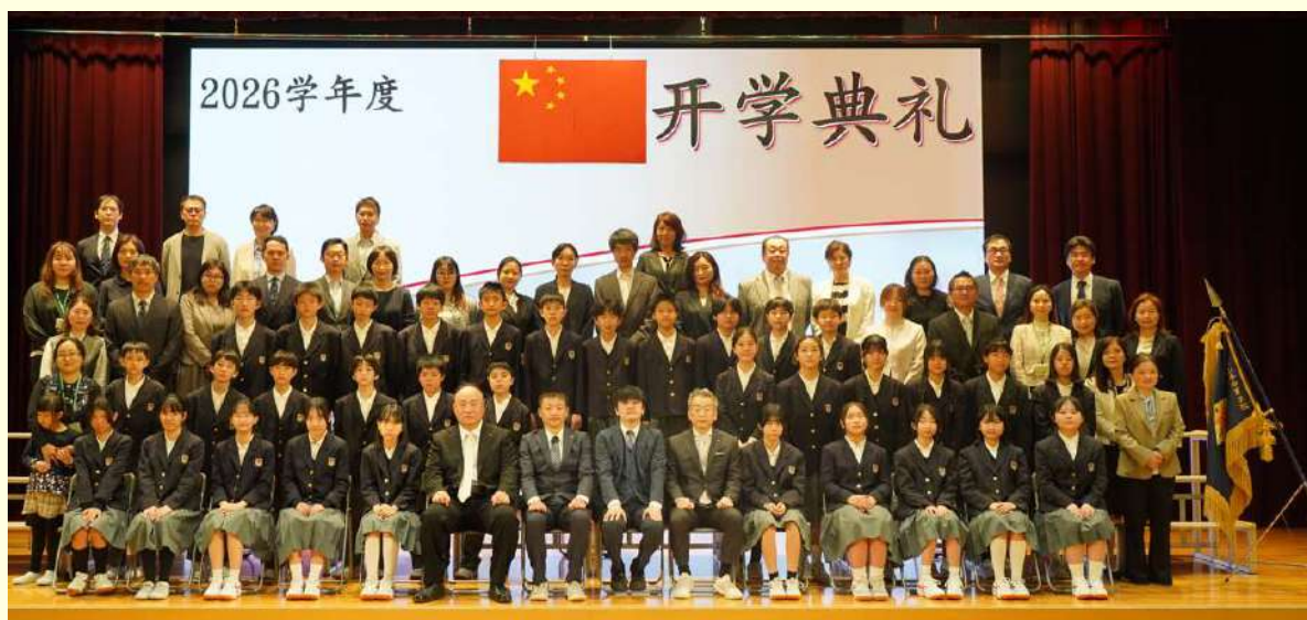
中一①班及家长合影