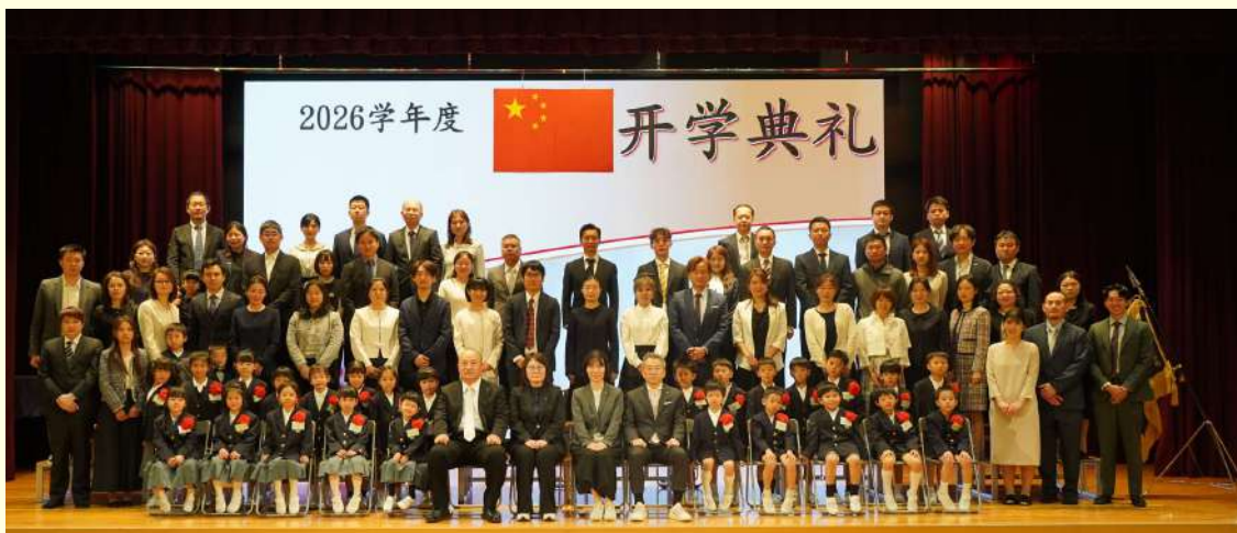
小一②班及家长合影