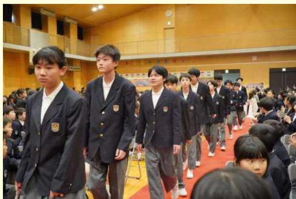
中学一年级新生入场