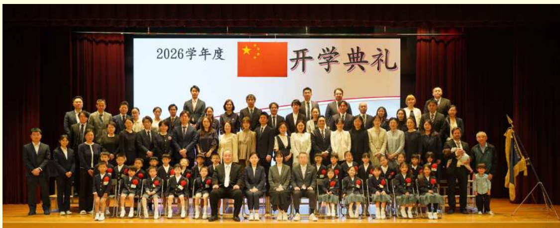
小一①班及家长合影