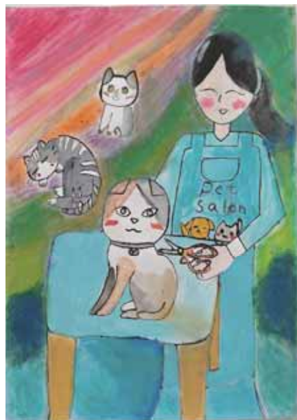
小六2班 林结喜 「猫とペットサロンで働く私」