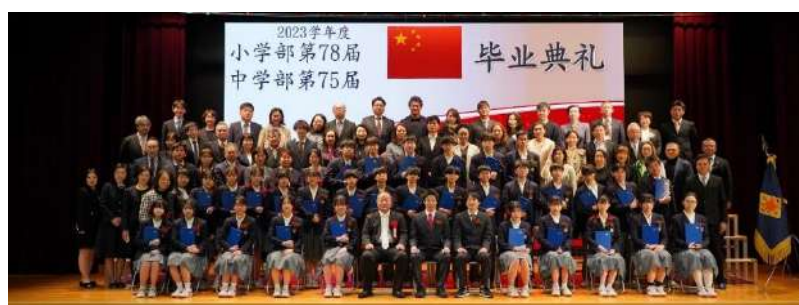
中三①班毕业生家长合影