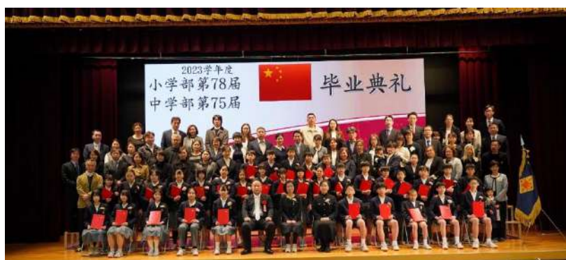
小六②班毕业生家长合影