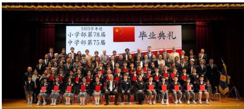
小六①班毕业生家长合影