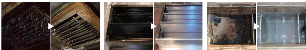
某中華料理店の防火ダンパー