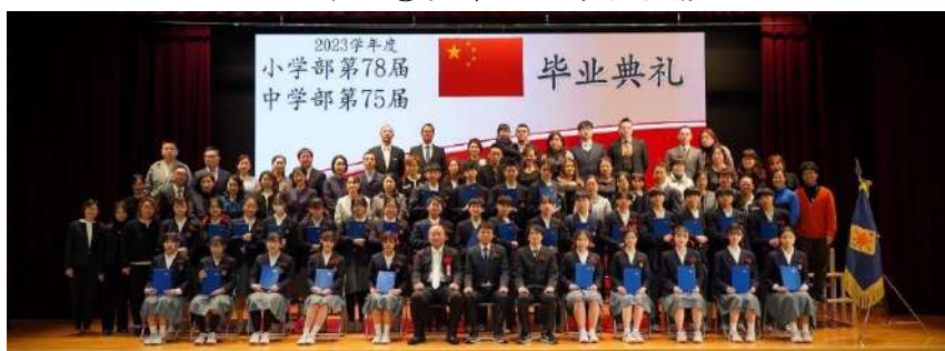
中三②班毕业生家长合影